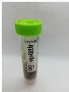
Foto del campione

Grado di umidità al momento dell'analisi - 12.2%