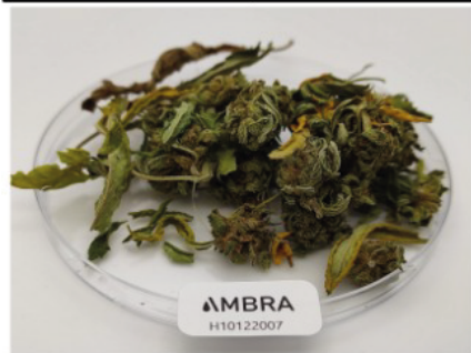
Foto del campione

Grado di umidità al momento dell'analisi - 10.26%